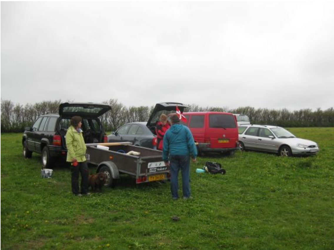
Når Vandhundene rykker ud er det med mange køretøjer...