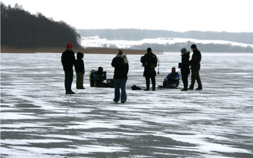
Flot og lidt koldt – vinden var ret kold !